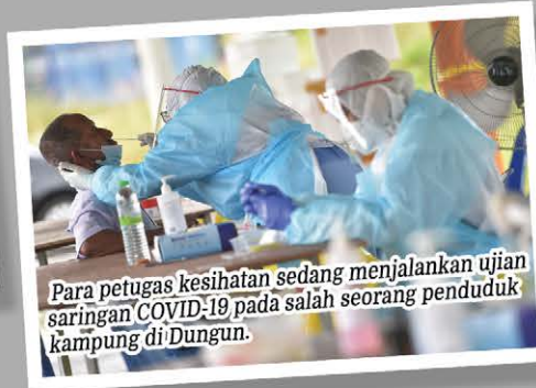
Para petugas kesihatan sedang menjalankan ujian saringan COVID-19 pada salah seorang penduduk kampung di Dungun.