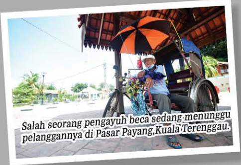
Salah seorang pengayuh beca sedang menunggu pelanggannya di Pasar Payang, Kuala Terengganu.