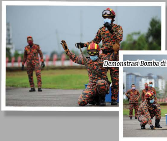
Demonstrasi Bomba di A