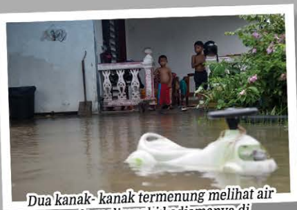
Dua kanak-kanak termenung melihat air yang mula melimpahi kediamannya di Chendering.