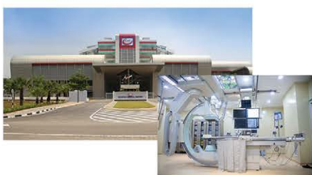
KMC dan KTS Hospital, 2 daripada 4 hospital milik TDM di bawah kelolaan KMI Healthcare mempunyai Makmal Kateterisasi Jantung (Cathlab).

Sejak pandemik COVID-19, KMI Healthcare telah keluar daripada kebiasaan dalam operasi perniagaan harian dengan semua Hospital KMI di