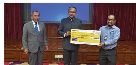
Selain sumbangan topeng muka, termometer inframerah dan sabun pembersih tangan, Kumpulan TDM turut menyumbang RM1.0 juta kepada Kerajaan Negeri Terengganu bagi membantu golongan yang memerlukan.

"Kami berdoa dan bermunajat kepada-Nya, semoga Allah SWT memberkati usaha Kumpulan TDM untuk terus memberikan nilai dalam membantu rakyat, komuniti dan Kerajaan Negeri," tambah beliau.