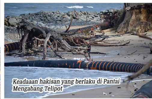
Keadaan hakisan yang berlaku di Pantai Mengabang Telipot