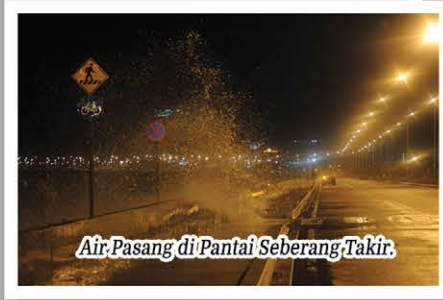
Air Pasang di Pantai Seberang Takir.