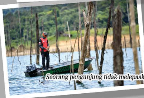
Seorang pengunjung tidak melepaskan peluang untuk memancing di Tasik Kenyir