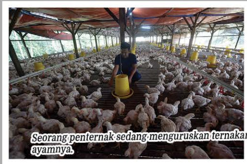
Seorang penternak sedang menguruskan ternakan ayamnya.