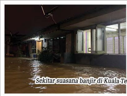
Sekitar suasana banjir di Kuala Terengganu.