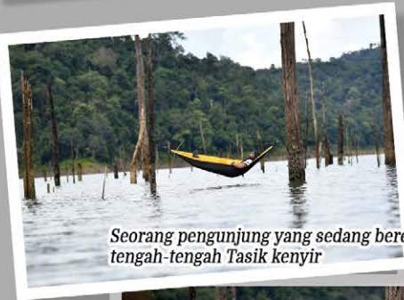
Seorang pengunjung yang sedang berehat pada pokok mati yang berada di tengah-tengah Tasik Kenyir