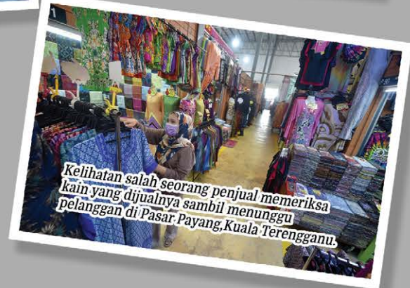
Kelihatan salah seorang penjual kain yang dijualnya sambil menunggu pelanggan di Pasar Payang, Kuala Terengganu.