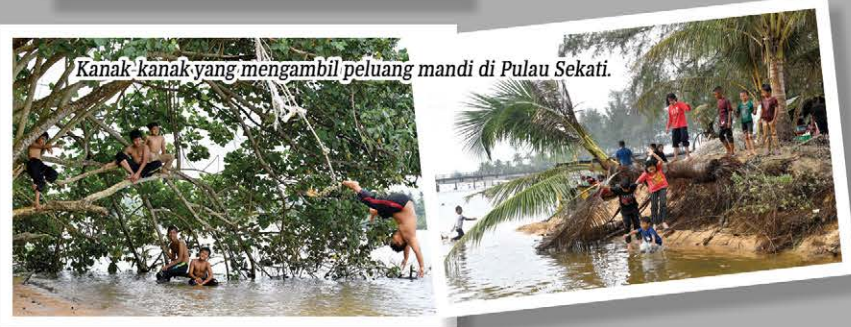
Kanak-kanak yang mengambil peluang mandi di Pulau Sekati.