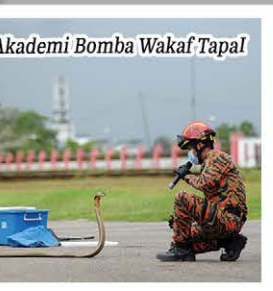
Akademi Bomba Wakaf Tapal